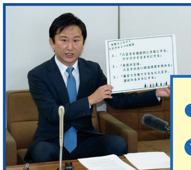
10月27日 八王子市役所で記者会見